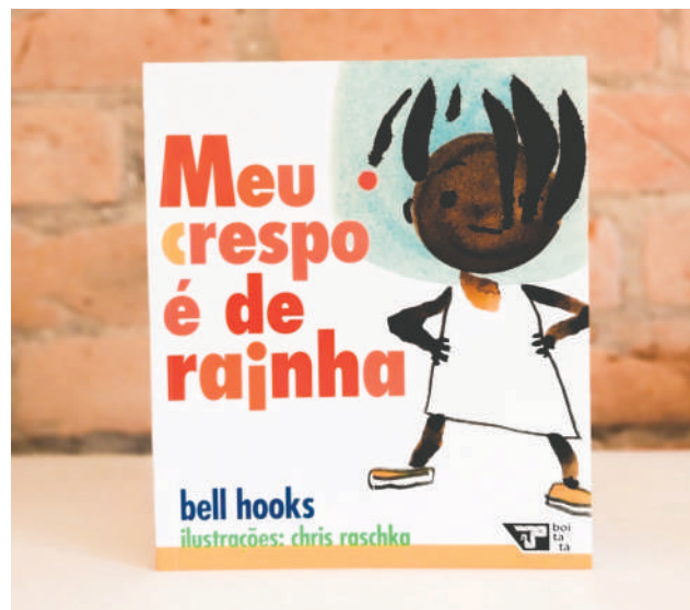
Livro "Meu crespo é de rainha" Autora: bell hooks