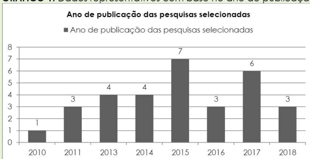
GRÁFICO 1: Dados representativos com base no ano de publicação