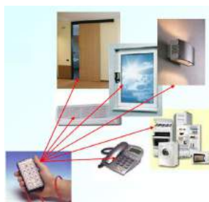
Fondazione Don Carlo Gnocchi Onlus - Milano R

As casas inteligentes podem também se auto ajustar às informações do ambiente como temperatura, luz, hora do dia, presença de ou ausência de objetos e movimentos, entre outros. Estas informações ativam uma programação de funções como apagar ou acender luzes, desligar fogo ou torneira, trancar ou abrir portas. No campo da Tecnologia Assistiva a automação residencial visa a promoção de maior independência no lar e também a proteção, a educação e o cuidado de pessoas idosas, dos que sofrem de demência ou que possuem deficiência intelectual.