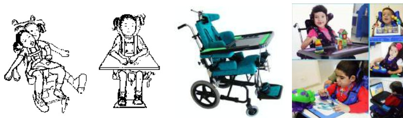
Desenho representativo da adequação postural, módulo postural em cadeira de rodas e várias crianças bem sentadas obtendo melhores condições para desempenhar atividades com as mãos .

Quando utilizados precocemente os recursos de adequação postural auxiliam na prevenção de deformidades corporais.