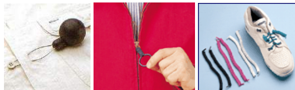
Vestuário (abotoador, argola para zíper e cadarço mola)