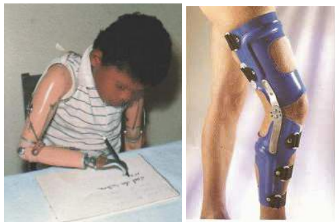
Próteses de membros superiores e órtese de membro inferior.

Órteses são colocadas junto a um segmento corpo, garantindo-lhe um melhor posicionamento, estabilização e/ou função. São normalmente confeccionadas sob medida e servem no auxílio de mobilidade, de funções manuais (escrita, digitação, utilização de talheres, manejo de objetos para higiene pessoal), correção postural, entre outros.