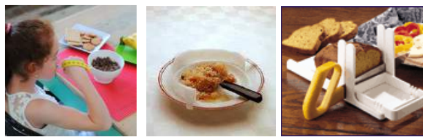
Alimentação (fixador do talher à mão, anteparo de alimentos no prato, fatiados de pão)

São exemplos os talheres modificados, suportes para utensílios domésticos, roupas desenhadas para facilitar o vestir e despir, abotoadores, velcro, recursos para transferência, barras de apoio, etc. Também estão incluídos nesta categoria os equipamentos que promovem a independência das pessoas com deficiência visual na realização de tarefas como: consultar o relógio, usar calculadora, verificar a temperatura do corpo, identificar se as luzes estão acesas ou apagadas, cozinhar, identificar cores e peças do vestuário, verificar pressão arterial, identificar chamadas telefônicas, escrever etc.