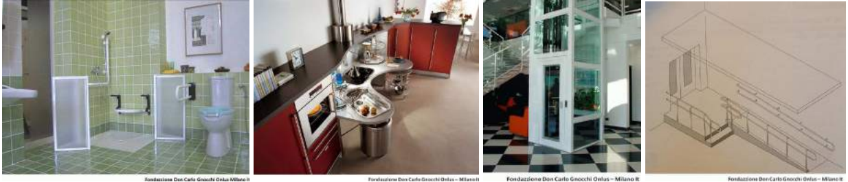
Projeto de acessibilidade no banheiro, cozinha, elevador e rampa externa.

Projetos de edificação e urbanismo que garantem acesso, funcionalidade e mobilidade a todas as pessoas, independente de sua condição física e sensorial. Adaptações estruturais e reformas na casa e/ou ambiente de trabalho, através de rampas, elevadores, adequações em banheiros, mobiliário entre outras, que retiram ou reduzem as barreiras físicas.