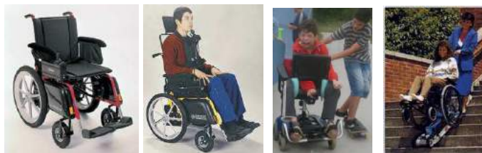
Cadeiras de rodas motorizadas; equipamento para cadeiras de rodas subirem e descerem escadas.

A mobilidade pode ser auxiliada por bengalas, muletas, andadores, carrinhos, cadeiras de rodas manuais ou elétricas, scooters e qualquer outro veículo, equipamento ou estratégia utilizada na melhoria da mobilidade pessoal.