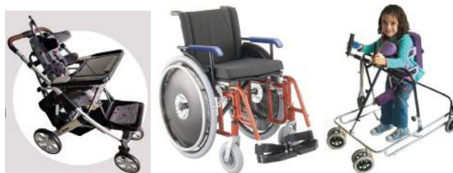
Carrinho de transporte infantil, cadeira de rodas de auto-propulsão, andador transfer.