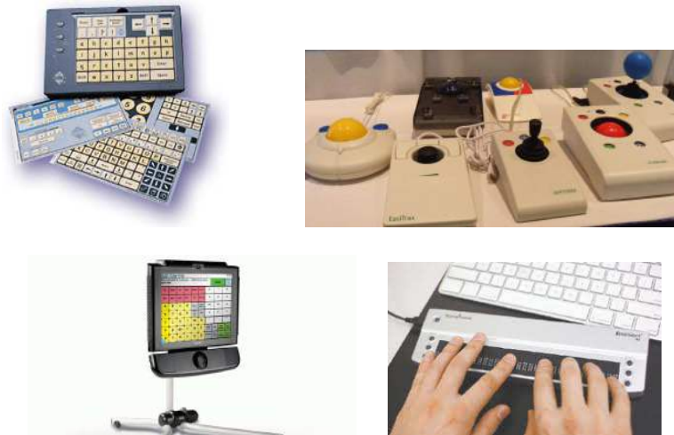
Teclado expandido e programável IntelliKeys, diferentes modelos de mouse e sistema EyeMax para controle do computador com movimento ocular, Linha Braille.